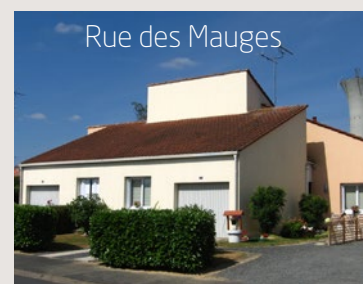
Rue des Mauges