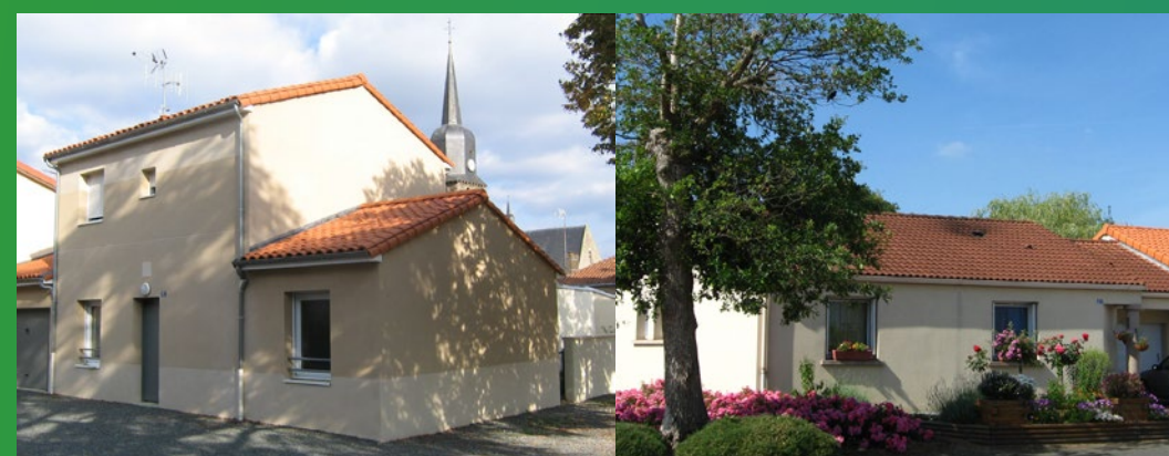
Rue Jeanne d'Arc