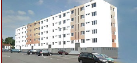
Favreau - Dumont d'Urville