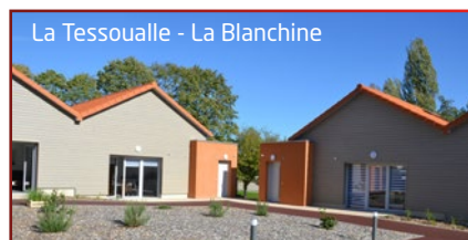
La Tessoualle - La Blanchine

Des logements adaptés aux besoins de chacun.